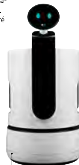
Le robot CLOi de LG devient le majordome de la maison