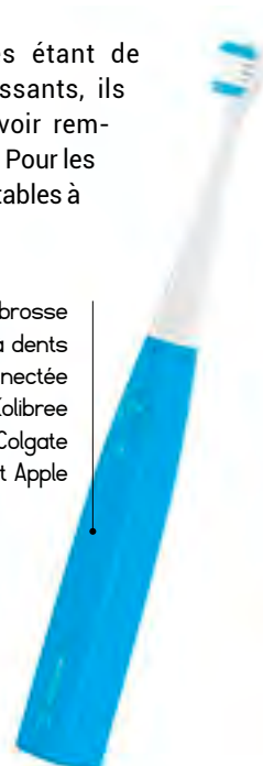
La brosse à dents connectée Kolibree avec Colgate et Apple