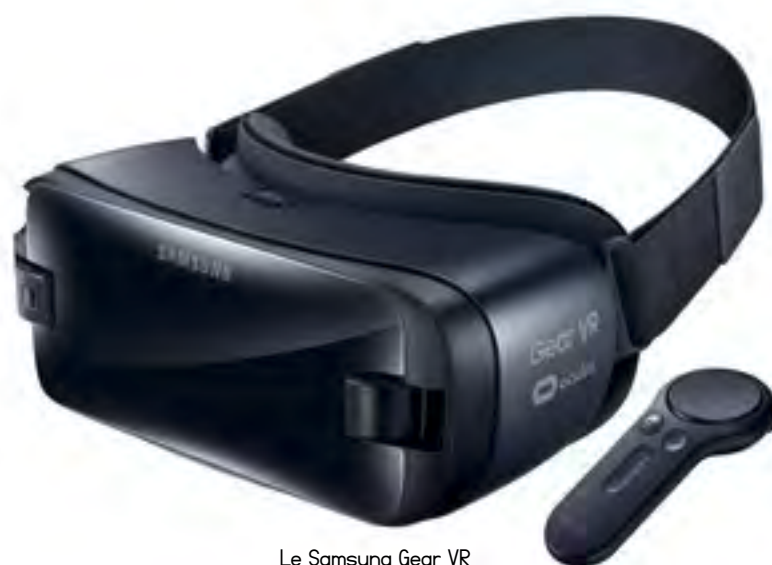
Le Samsung Gear VR avec son contrôle pour une immersion totale dans le jeu

SkillKorp, marque de gaming distribuée exclusivement dans l'enseigne Boulanger, propose son casque de gaming SKP_H20 pour une immersion totale dans les jeux sur ordinateur. Les écouteurs sont de type Circum Aural et le son est Surround 7.1, complété par des moteurs de vibration intégrés. Il comporte un micro rétractable omni directionnel, et le câble intègre une télécommande.