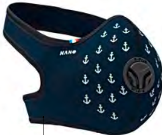
Le masque R-Pur filtre les nano-particules