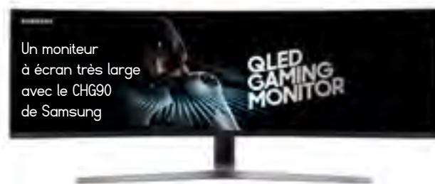
Un moniteur à écran très large avec le CHG90 de Samsung

Il faut désormais compter sur les jeux vidéo et les consoles rétro chez les collectionneurs. La nostalgie a donc gagné les gamers, et de plus en plus d'entre eux sont prêts à dépenser de petites fortunes pour acquérir d'anciennes consoles ou jeux. Le site Catawiki a enregistré des enchères record : Les Championnats du Monde Nintendo, édition or (1990, 15 000 € minimum), The Legend of Zelda : Minish Cap : édition limitée Adventure pour Gameboy Advance (300 exemplaires, plus de 1000 €), Earthbound pour Nintendo SNES (entre 200 et 650 €), The Legend of Zelda (330 €), ou encore Conker's Bad Fur Day pour Nintendo 64 (2001, 180 €).