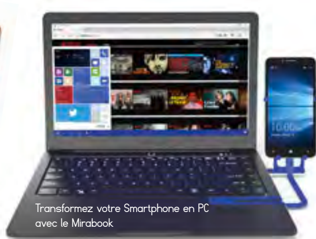
Transformez votre Smartphone en PC avec le Mirabook