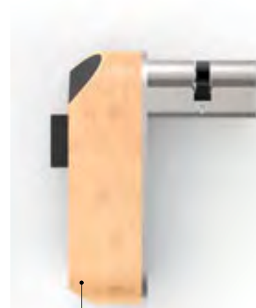
La serrure connectée HAVR s'ouvre grâce à la lumière

pour obtenir les certifications. Nous avons aussi noté une implication massive des régions, qui ont multiplié les efforts pour porter les Startups qui ont élu domicile sur leurs territoires respectifs.