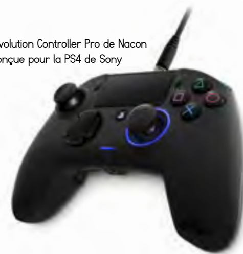
La Revolution Controller Pro de Nacon est conçue pour la PS4 de Sony

NETGEAR a développé son switch Nighthawk S8000 spécialement pour le gaming et le multimédia. Les connexions réseau Gigabit sont jusqu'à 4 fois plus rapides, pour organiser des parties de jeux multi-joueurs sans latence. Chaque port est configurable de manière autonome, et son design est futuriste. Son prix public conseillé est de 150 € TTC.