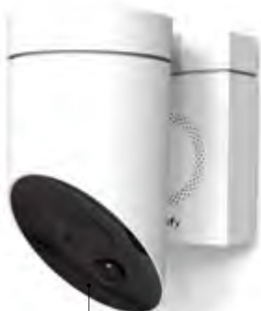
La caméra d'extérieur MyFox de Somfy reconnaît les intrus