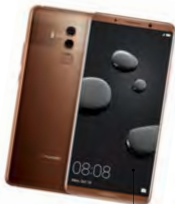
L'IA entre dans les Smartphones avec le Huawei Mate 10 Pro

Les grandes entreprises sont directement impliqués, souvent par le rachat, comme Withings chez Nokia et Myfox chez Somfy, ou le partenariat comme Netatmo avec Le-grand. La Poste, qui portait 14 Startups dans le domaine de la santé à domicile, Valéo, Dassault Système, Faurecia, L'Oréal, Michelin et Total n'étaient pas en reste, mais ils doivent faire face aux géants américains que sont Google, Amazon et Apple. Les deux domaines de prédilection de la France sont la maison et la santé, mais il reste encore à simplifier le côté administratif, nombreux des acteurs se plaignant de délais trop longs