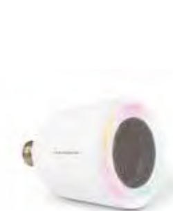
Réglez l'éclairage mais aussi diffusez du son depuis votre Smartphone

Le THRFIT1000, premier radiateur connecté de Thomson, dispo-