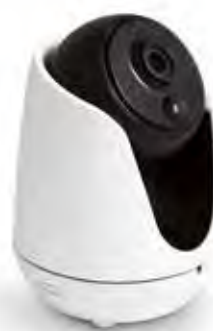
Une caméra connectée orientable