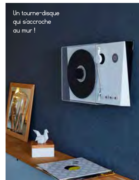
Un tourne-disque qui s'accroche au mur !

nible en 1000, 1500 et 2000 Watts, se connecte à votre réseau en Wifi, afin de le piloter par la voix via les services de reconnaissance vocale Google home & Amazon Alexa. Muni d'un thermostat électronique digital et d'un écran LCD à éclairage blanc, il propose quatre modes de fonctionnement et une programmation hebdomadaire. Son détecteur d'ouverture de fenêtre permet de baisser automatiquement sa température pour éviter les pertes d'énergie.