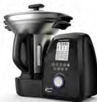
Le premier robot cuiseur connecté de Thomson