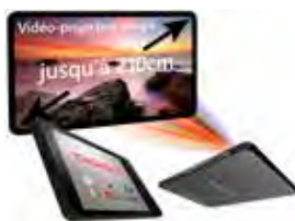
Le vidéoprojecteur est intégré dans la tablette