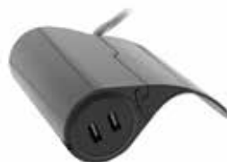
Multiprise secteur & USB spéciale canapé