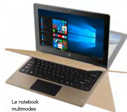
Le notebook multimodes