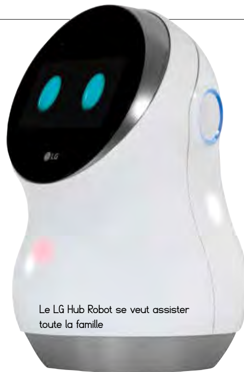
Le LG Hub Robot se veut assister toute la famille