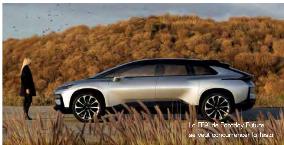
La FF91 de Faraday Future se veut concurrencer la Tesla

Les jeunes enfants peuvent désormais dormir avec REMI de chez UrbanHello. À la fois un réveil, une veilleuse, un babyphone et une enceinte connectée, c'est aussi un suiveur de sommeil qui produit un rapport détaillé de la nuit des petits. Son afficheur indique à l'enfant s'il a assez dormi ou s'il doit encore rester au lit. ●