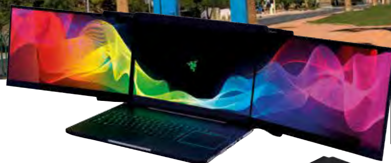
Le prototype Valerie de Razer comporte 3 écrans 4K rétractables

le marché grand public, principalement pour les jeux.