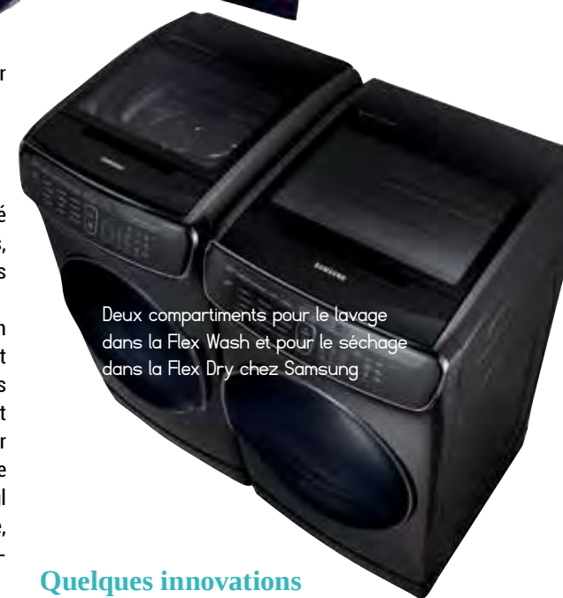
Deux compartiments pour le lavage dans la Flex Wash et pour le séchage dans la Flex Dry chez Samsung

Chez Sony, l'adaptation de l'OLED dans son modèle XBR-A1E est complétée par un traitement du son maison avec sa technologie « Acoustic Surface », qui consiste à projeter le son depuis l'écran, comme si les haut-parleurs se trouvaient derrière celui-ci.