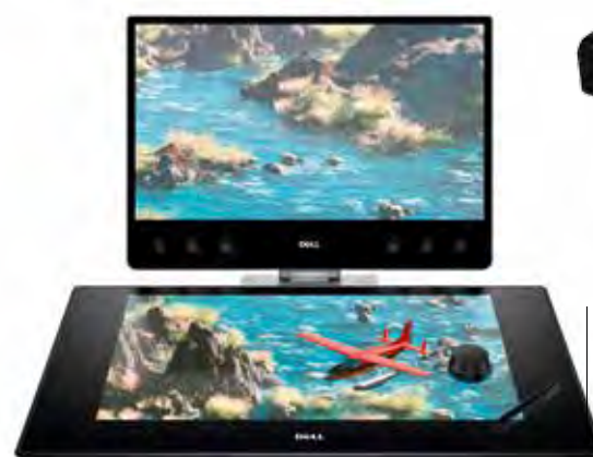
Le Canvas de Dell s'inspire du Surface de Microsoft

●●● Le Dell XPS 27 qui a particulièrement soigné la reproduction sonore, et surtout le HP Envy Curved 34, avec sa dalle incurvée de 34" au format 21/9, comme au cinéma. Ce dernier incorpore un système audio développé par B&O comportant 6 transducteurs dont deux passifs. Samsung, qui semblait moins présent dans le monde du PC ces derniers temps, a présenté les Samsung Pro (puce Intel) et Plus (puce ARM), deux Chromebooks compatibles Android, donnant ainsi accès à l'ensemble des applications disponibles dans le système de Google. Enfin, pour les consommateurs de très grosses données, Kingston a introduit ses DataTraveler Ultimate GT, des clés USB de 1 To et 2 To, ou 2 To, qui tiennent dans un boîtier de 72x27x21 mm, permettant de stocker près de 50 films en 4K.