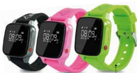
Chez Haier on pense aux petits comme aux anciens, avec un modèle pour enfants et un autre pour seniors, tous deux étanches et munis d'un bouton SOS pouvant appeler jusqu'à 3 numéros en cas d'urgence.