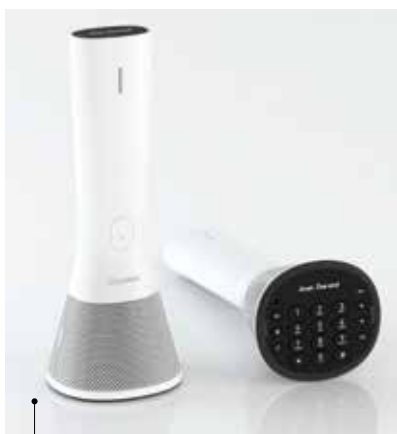
Le Home Phone d'UrbanHello est compatible avec le son HD de toutes les box Internet

journée entière, alors pourquoi ne pas l'équiper d'une coque avec batterie, comme celle de Xtorm. Bien sur cela augmente le volume de l'appareil, mais au moins vous pourrez téléphoner jusqu'à la tombée de la nuit. Vous pouvez aussi avoir dans une poche de veste ou un sac à main une batterie de secours. Faites une bonne action en achetant la CL51 de PNY en Edition Ruban Rose, pour soutenir l'association « Cancer du Sein, Parlons-En ! ». Pour les amateurs de sensations extrêmes, n'ayez plus peur d'emporter votre Smartphone, en le protégeant d'une coque étanche LifeProof, disponible entre autres chez Carrefour, Darty, Boulanger et Fnac, au prix de 80 € TTC. Vous avez juste besoin d'une jolie coque de protection, alors faites votre choix chez Macally, qui propose une gamme étendue de coques souples et rigides.