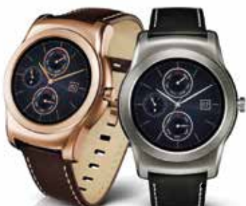
La LG Watch Urbane est déclinée en deux modèles, dont un 4G/LTE.