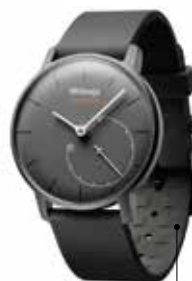
L'Activité Pop de Withings a un prix plus abordable (150 € TTC) que l'Activité lancée l'an passé (390 € TTC)