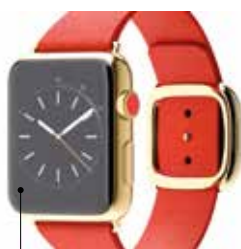
Apple s'est lancé dans la course de la montre connectée, restant fidèle à son modèle de produits premium, les prix allant de 395 € à plus de 10.000 € TTC