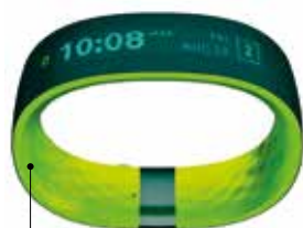
HTC s'est associé à l'américain UA Record pour proposer le Grip, un bracelet multisports comportant un GPS

pour que ces capteurs nous affichent de plus en plus d'informations, que ce soit le numéro de l'appelant, les sms, les emails, etc. Quoi de plus naturel alors que ces modèles sans forme commune se transforment en montres, que nous avons vues se pointer chez la plupart des grands fabricants d'électronique. Et même les derniers modèles savent téléphoner, nous guider par cartographie,