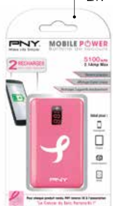
Pour chaque achat d'une batterie de secours CL51 Ruban Rose, PNY reverse 1 € à l'association « Cancer du Sein, Parlons-En ! »

Encore et toujours, l'accessoire reste un élément important dans le marché de la mobilité. D'une part cela reste un produit qui reste attractif dans les rayons, d'autre part les marges demeurent confortables. Le marché des Smartphones ayant évolué vers une vente en renouvellement par achat déconnecté du forfait, suite à la prise de marché du forfait sans engagement, cela signifie que le consommateur achète un appareil à son juste prix. Il a donc encore plus envie de le protéger contre les rayures et les chutes, en l'équipant d'une protection d'écran et d'un étui ou d'une coque avec batterie. Votre iPhone 6, si vous l'utilisez intensément, comme la plupart des Smartphones, ne tient pas la charge une