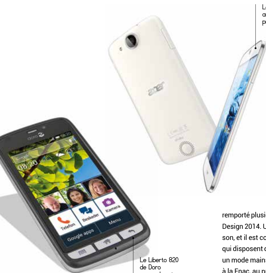
Le Jade Z ressemble au Jade S annoncé récemment, mais son prix est plus attractif