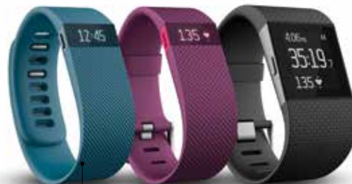
Fitbit, un des premiers fabricants de bracelets connectés, annonce deux nouveaux modèles, avec le Charge HR et le Surge, ce dernier intégrant un GPS.