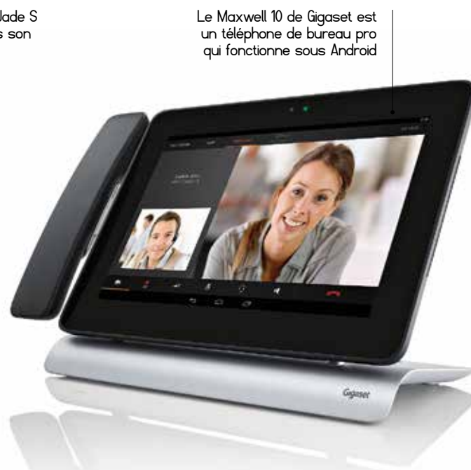
Le Maxwell 10 de Gigaset est un téléphone de bureau pro qui fonctionne sous Android