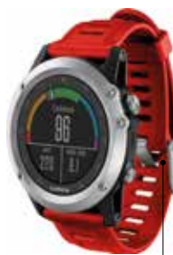
Garmin a annoncé de nombreux modèles au CES de Las Vegas, dont la Fenix 3, un modèle multisports comportant un GPS

prendre des photos, télécommander sa voiture, et même payer à la caisse. Qui plus est, Apple vient d'entrer dans la danse avec son Apple Watch, avec une forte chance de faire bouger la concurrence.