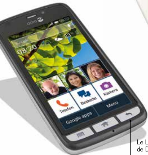
Le Liberto 820 de Doro a reçu le prix du « Meilleur appareil mobile pour l'accessibilité et l'inclusion »

remporté plusieurs prix dont l'Etoile de l'Observateur du Design 2014. Un de ses points forts est le traitement du son, et il est compatible avec toutes les box françaises qui disposent du son HD. Sa forme particulière autorise un mode mains-libres à 360°. On le trouve par exemple à la Fnac, au prix de 149 € TTC.