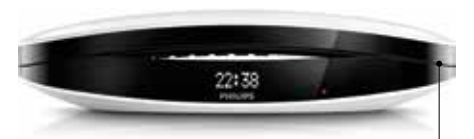
Le Philips Luceo comporte deux afficheurs, dont un sur la base

Le téléphone à la maison ressemble de moins en moins à celui que l'on utilisait jusqu'alors, s'adaptant aux nouveaux usages. Ainsi chez Invoxia, le Tribby, spécialement conçu pour la cuisine, a été présenté au CES de janvier. Il se présente sous la forme d'un cadre carré qui s'aimante sur le réfrigérateur, et il est aussi facile de téléphoner, de l'utiliser comme système sans fil pour son Smartphone ou d'écouter la radio ou sa musique. De plus le Tribby est un post-it connecté via son écran en façade. Il doit arriver dans les rayons pour le printemps au prix annoncé de 199 € TTC. Gigaset a annoncé à la fin 2014 trois nouveaux téléphones DECT, dont les prix se situent entre 30 et 80 € TTC Leur particularité est de disposer d'un mode éco DECT, qui permet de réduire, selon le constructeur, la consommation jusqu'à 80%. Le Philips/Woox Luceo a lui aussi été annoncé au CES de Las Vegas, mariant le design et la technologie. Il dispose de deux écrans à affichage inversé noir sur blanc, l'un sur le combiné et l'autre sur la base. Disposant de son Philips HQ, permettant les conversations mains libres, il sera disponible en France à partir d'avril 2015 au prix public conseillé de 80 € TTC. Le Home Phone d'UrbanHello est déjà arrivé il y a un certain temps, mais son design ne peut pas laisser indifférent. Il a d'ailleurs